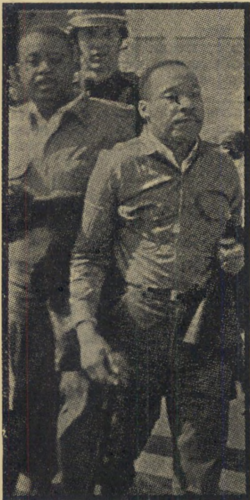
קינג (מימין) בדרך למאמר אם יש קול, יש קשב

** בישראל מתו ב-1962 8 איש כתוצאה מעגבת. ב-1963 — 9.