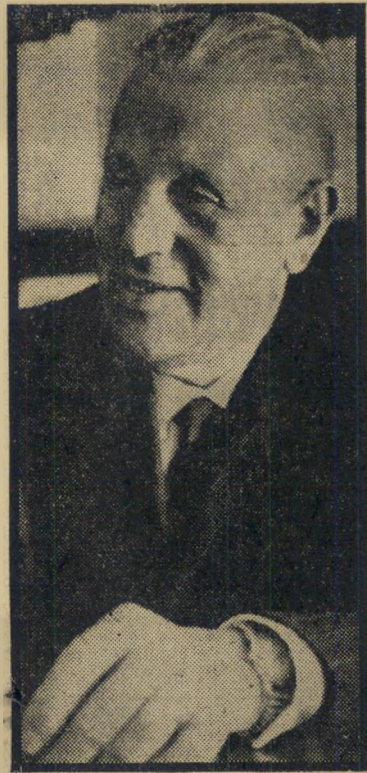
מזכיר כדני חסונה

ועידת הפיסגה הערבית השניה, לא דנה רק בענין הטיית יובלי הירדן. בעיה חסרה בה אחרת שהועלתה, הייתה בעיית הבורות בעולם הערבי. השאלה הועלתה דווקא על ידי נשיא אלג'יריה אחמד בן בלה, שבעצמו למד לקרוא ולכתוב ערבית בימי שהותו בשבי הצרפתי. בתום ההיעידה נתאספו באלכסנדריה נציגי משרדי החינוך של כל ארצות ערב, שהחליטו להכריז מלחמת קודש על האנאלפאביות. בעולם הערבי נמצאים 42 מיליון אנשים שאינם יודעים קרוא וכתוב, קבעו המ הנכים, יש לחסל את הנגע הזה תוך עשר שנים. מכיוון שקשה ללמד את כל האזרחים בבת אחת, הוחלט להתחיל עם בני הגילים 40-10. כל חינוך יעלה שתיים-יחצי לירות