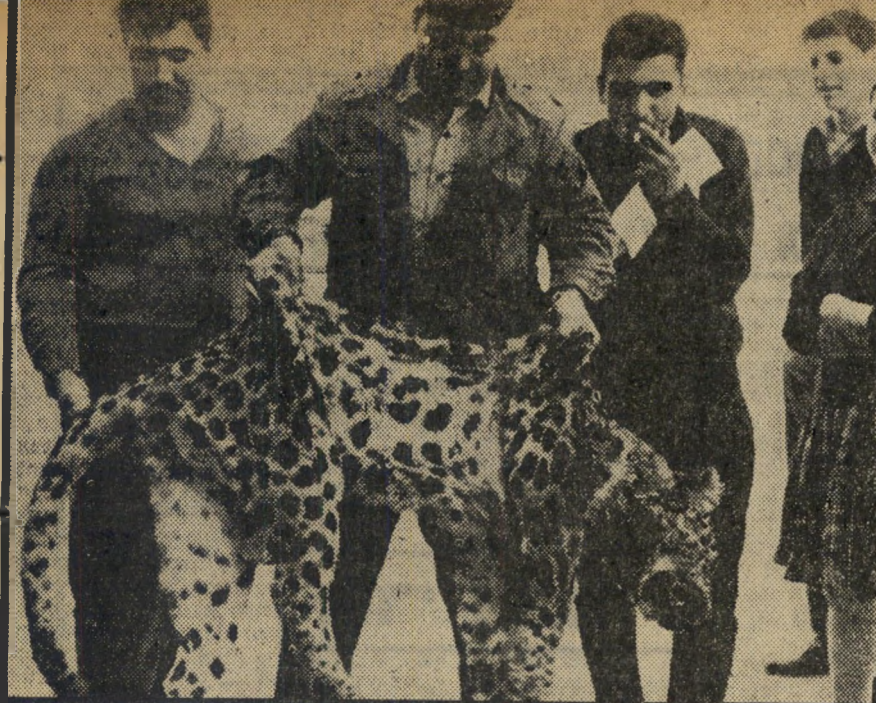
הנמר בידו מנצחיו* הכושי לא החליף את עורו —

ואותם מדינאים גדולים ובטחונאים גדולים, שהוכיחו בפרשת גרמניה קבל עם ועולם את חוסר-כשרונם הפיננאלי — הם שימיכו לנהל את ענייני ישראל, לעצב את מדיניותה (אם אפשר לקרוא לזה מדיניות, מבלי לאנוס את המילה) ולדחף לאומה על כשלונותיה. עד מתי?