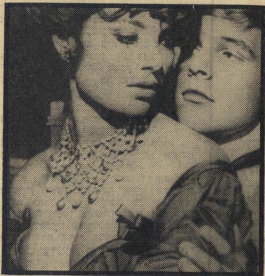
פרייטש זוכייה ב"כשהם לברם בחדר" האב נתן דוגמא

הבמאי רוג'ה ואדים, זה שנתן לעולם את בריג'יס בארדו, עזב את מכורתו הקולנועית, צרפת, והלך לעשות סרט באמריקה. שאלו אותו מדוע הוא הלך לאמריקה, והוא ענה: "אחמול טילפן אלי עיתונאי אחד ו-