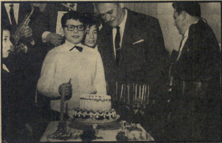
יומלה שוחמאכר בכרימצווה סבא בגונה

לגובה, החל להדוף כדור ברזל, לאחר שסבל לאחרונה מכאבי-גב והרופא לא הירשה לו לקפוץ. השחקן הגבוה, המופיע בשם ה' פועל תלאיבי בליגה האתלטיקה, תפס ב' שבוע שעבר את המקום הרביעי — מבין ששה מתחרים — בתחרות בהריפת כדור