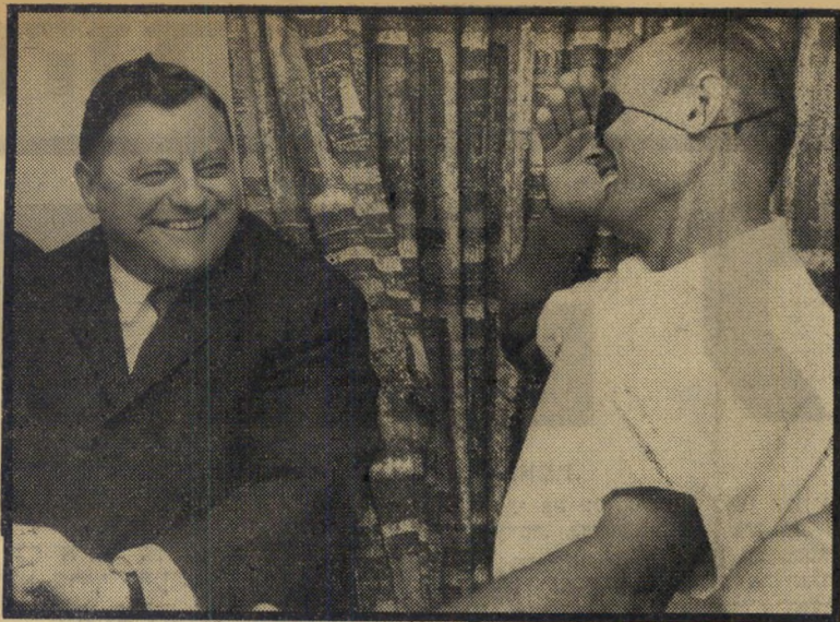
משה דיין ופראנקייזוף שטראום היחיד

במצב הנתון, מוכרחה עמדת הערבים להתנגש בעמדת ישראל. המלחמה נראית בלתי-נמנעת, אלא אם כן תקדיש ממשלת ישראל את כל כוחותיה, בחודשים הקרובים, לשינוי המצב (העולם הזה 1428). אך זה אינו קל. הדבר מחייב יוזמה חדשה, גישה חדשה, רעיונות חדשים, מאמצים חדשים. אין זה תפקיד לעסקנים קשישים, נטולי מעוף ודמיון, העוסקים עד מעל לראש בקנוניות מפלגתיות. אם כן, מה לעשות?