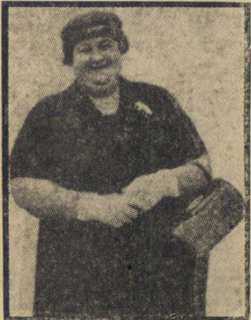
לזיטה שמאקי מי שמו, בעצם

לדעת סוכן הפירסום, היו המילים "בעלת ידיעה מושלמת בעברית" חשובות, על כן ציין בתחילת השורה "שמונה". כלומר: יש להשתמש באות שמונה לסיפור המשפט. עובד הדפוס, שנשל את המודעה לסיפור, לא עמד על הדקויות של רצון המפרסם, צירף את המלה "שמונה" לתוכן המודעה. כך קרה, שבגליון ג'רוסלס פוסט של יום הכתרת הופיעה מודעה, אשר חיפשה מזכירה מינהלית מנוסה, מדרגה ראשונה, שמונה, בעלת ידיעה מושלמת בעברית.