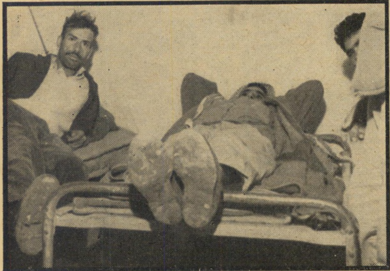
פועלים ערביים בדרום תל-אביב ג'ונגל בלב העיר

משפחתם, כפי שמגיע לכל פועל בחברה תרבותית.