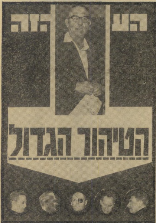
שער "העולם הזה" 1370 (דצמבר 1963)

כפי שראית, בחרנו בדרך פשוטה. פירטנו בכל שבוע את תוכן היומן, על פרסומותיו