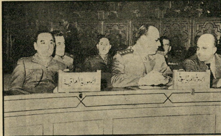
רמטכ"ל עיראק (במרכז) בראש המשלחת העיראקית-סורית "פעילות הבעת הפאשיסטית" —

הם היו לבושים בצבע אחד, דיברו שפה אחת. הכותרות שתוארו את כינוסם, בעתוני קהיר, אף דיברו על "תוכנית צבאית אחת". אולם כאשר התפרסם הרמטכ"ל הערביים, היה ברור לגמרי למשקפים, כי לא הצליחו לגבש עמדה ביחס למוביל המים הישראלי. הם עצמם לא אהרו בזאת. להיפך: אחרי