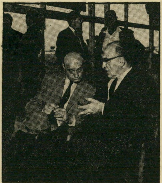
אשכול וגוברין, עם דיין ברקע שר על תנאי

גיחה שניה עשה כעבור שנים אחדות. אז הגיע עד לתפקיד הרם של מזכיר ההסתדרות, אבל גם מכאן מיהר להסתלק — מפני אותו חשש — וחזר לשמור על ביסוסו.