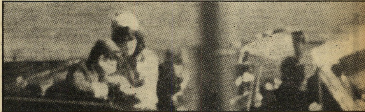
3. אשת הנשיא הבחינה שקרה משהו. עדיין לא ברור לה מה קרה. קנדי נופל — הצידה.