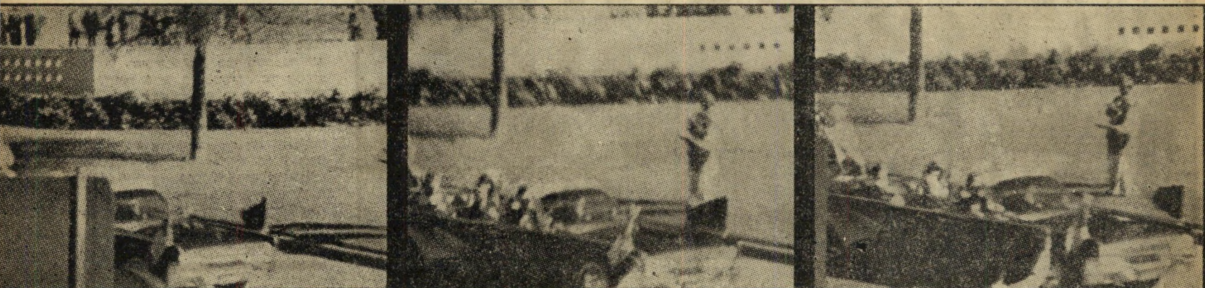
2. שניה לפני הרגע הגורלי: המכונית כבר חלפה על פני חלון הרוצח והמשיכה כמה עשרות מטרים, לנקודת הרצח.

כך נרצח קנדי. תמונות אלה לקוחות מ־ סרט של שמונה מילימטרים, שצולם במקום ההתרחשות עליידי חובב, ופורסם השבוע מעל עמודי השבועון המצוייר לייף. הן מב־ הירות כמה נקודות סתומות.