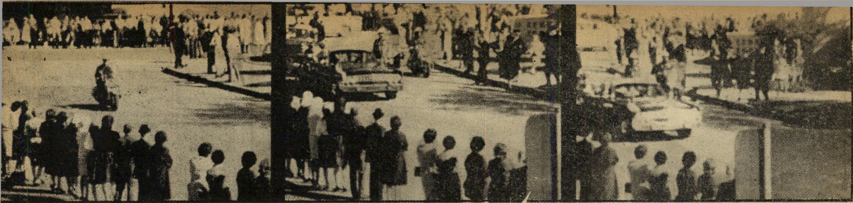
1. סביב הפינה הגורלית מופיע תחילה שוטר על אופנוע (שמאל) ואחריו מכונית הנשיא (ימין), המנופף לקהל הידידותי.