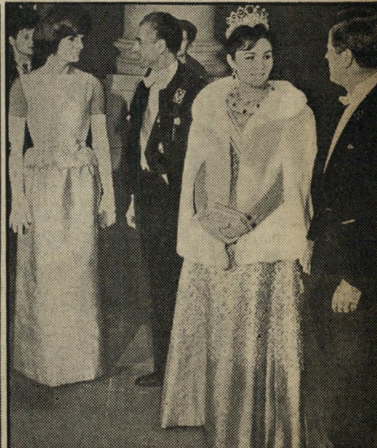
עם קיסר פרס