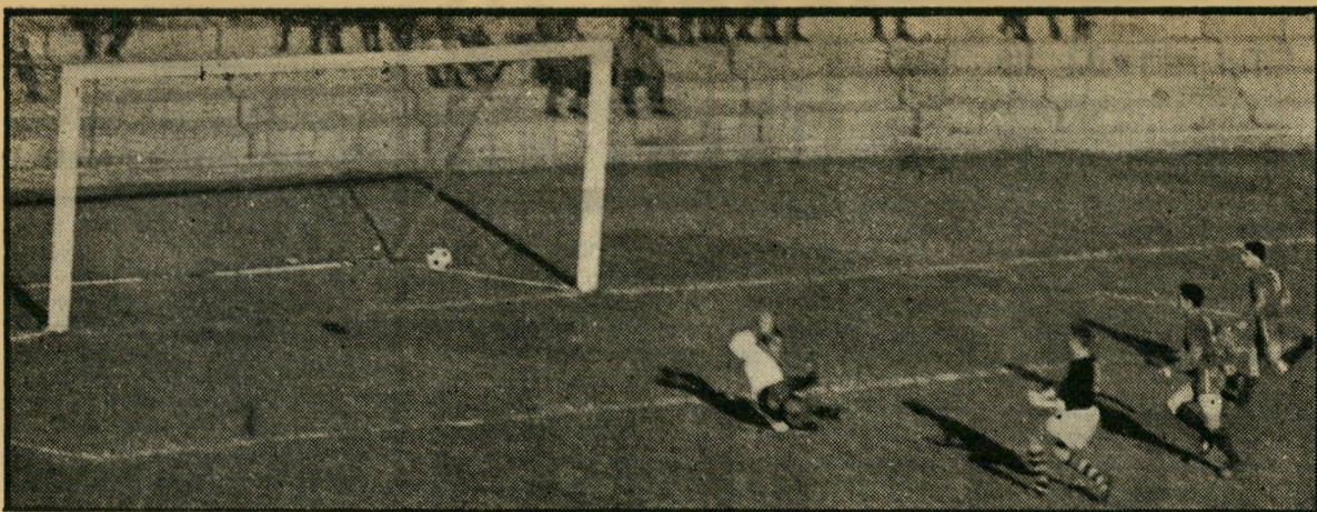
יצחק יוסקוב סופג את השער הבודד לחובת הנבחרת צפוניים בחופשה