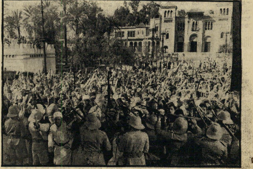
בסרם: הבריטיים מול ההמון הלאומי של העיר דמשק

פשוטו כמשמעו. מטפרי-הלימוד הערביים נתלשו הדפים בהם מוזכר המרד. לפחות מורה ערבי אחד פוטר מפני שהעו, למרות זאת, להזכיר פרשה זו בכיתתו.