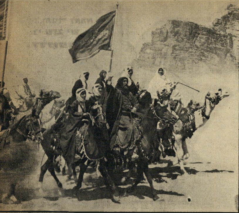
כיבוש עקבה בסרם: הדגל בידי אבו-מאי, לורנס מייצג