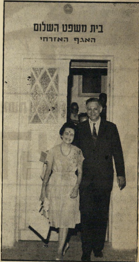
בית משפט השלום האגף האזרחי