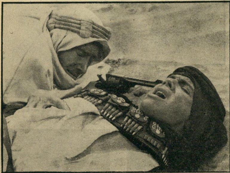
לורנס (שמאל) הורג את משרתו אונס עם השלכות פוליטיות

מה אירע אשתקד במאריינבאד? לא אירע דבר. אשתקד לא היה בכלל. מאריינבאד אינה קיימת. גם בסרט עצמו לא קורה שום דבר. כל מה שמחולל תוך הקרנת הסרט מתרחש במוחו ובנפשו של הצופה בלבד. הסרט עצמו מספק רק נתון נים יסודיים להתרחשות חזיתית אינדיבידואלית אצל כל צופה וצופה. הוא מגיש מציאות קולנועית ראשונית, בחינת תורה ובוהו, משאיר לצופה להיות האלוהים שלה, להפ-