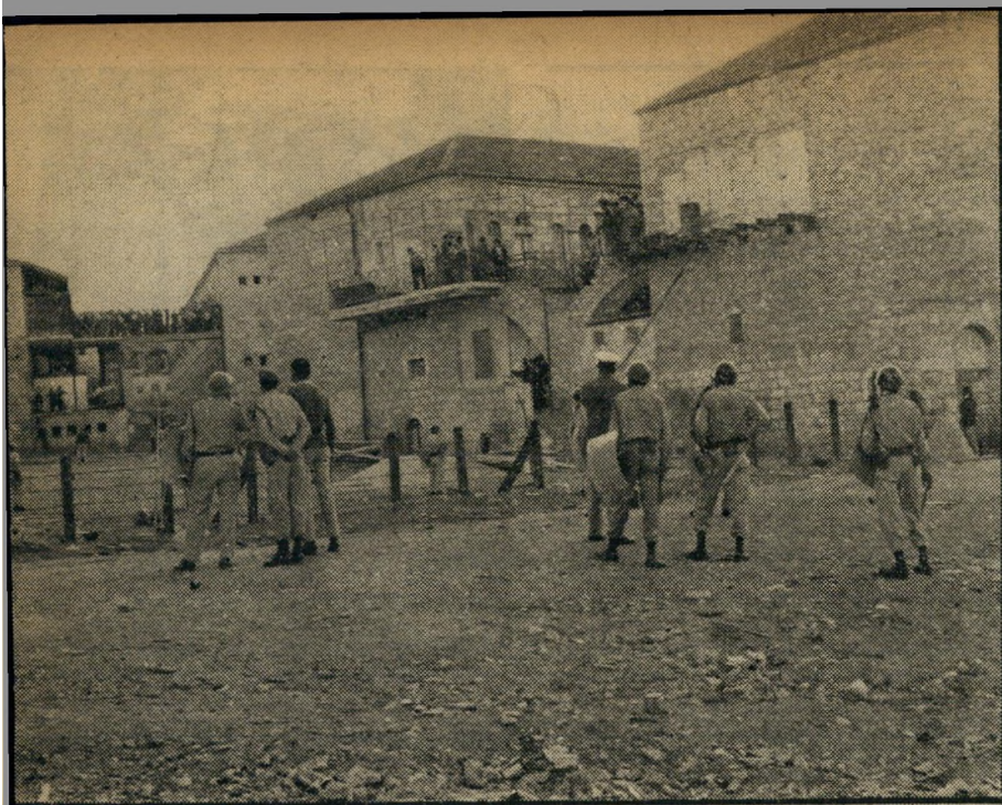
כך זה התחיל לאחר שנת אחר-הצהריים יצאו תושבי בתי אונגרין למרפסות המגשרות בין הבתים, החלו להמסיר משם חרפות ושברי-כלים על השוטרים, שהטילו מצור על השכונה כדי למנוע בעד תושביה הקנאים מלהמשיך בהתפרעויות.