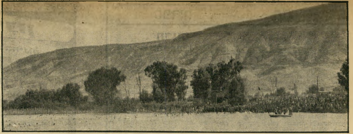
הצולחים מוזנקים מחוף האין מהר, מהר — 9 תאחרו הכינרת יורדת לנגב, חבר!