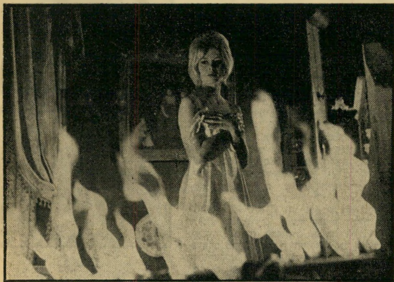
בריגיט בארדו כמנוחת הלוהם רביצה אינסופית במיטה

אליה השבונה (מוגרבי, תל-אביב; אר צות-הברית) היא סאטירה מוסיקאלית עוק צנית על אחת התופעות האמריקאיות הבול טות ביותר, שעד לפני שבוע יכלו צופי הקולנוע בישראל לראות בה פארודיה על האמריקאים בכללותם. אולם אחרי ביקורו של הומר קליף ריצ'ארד בישראל והתופעות שהתרחשו סביב ביקור זה, יכול הסרט לשמש בשקט גם סאטירה על הנוער הי