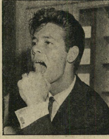
"שפתיים בנות מזל"