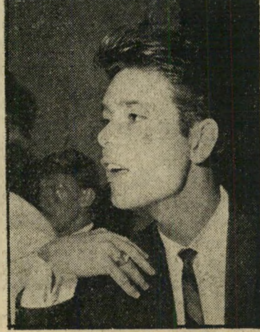
"אני אומרים: כן!"