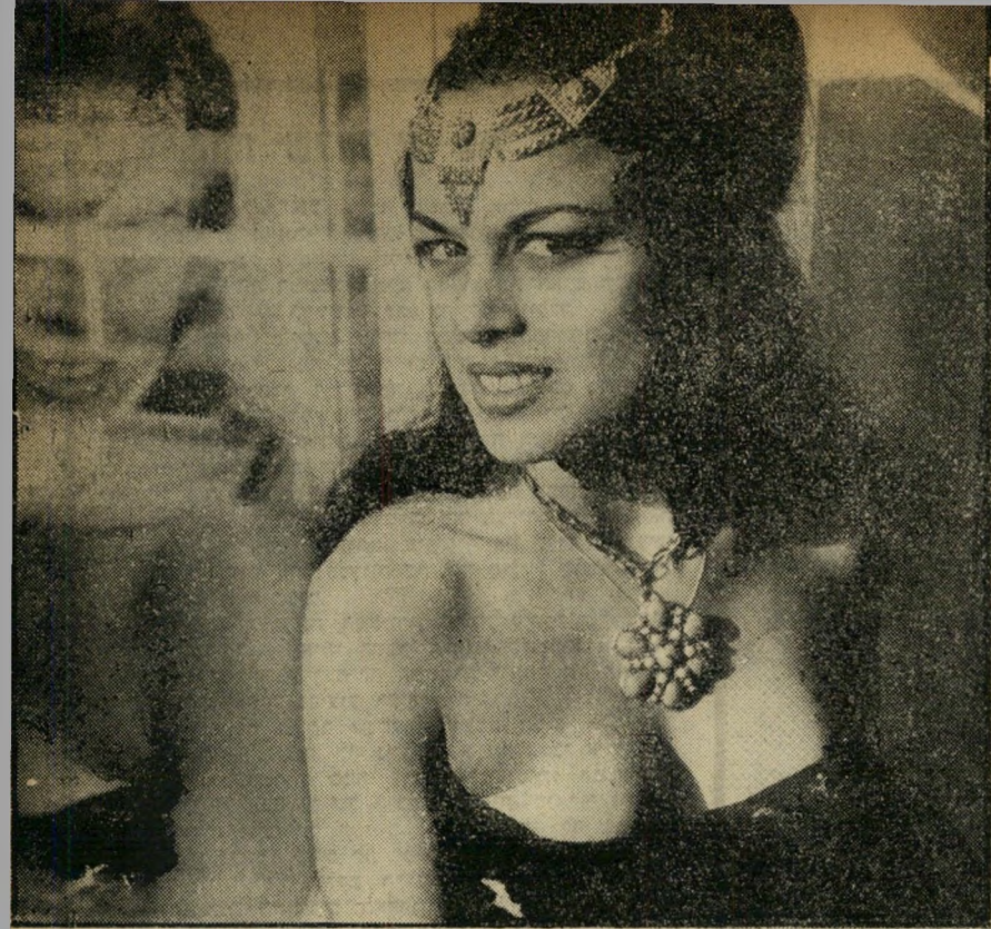
גודלה של גוד משתקף כדמותה החדשה של עליזה, בעומדה לפני ה' ראי. עוד בסכס נשואיה של מי שהיתה מלכת-היופי של ישראל וסגנית מלכת-המים של העולם הזה, הצהירה כי ברצונה להיות לכוכבת קולנוע.