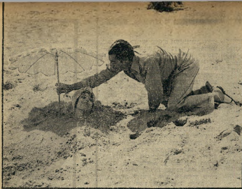
4. גירושין נוסח איטליה (איטליה)