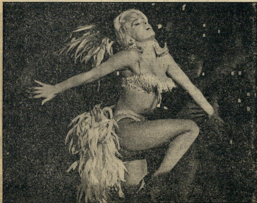
4. היפוליטה היפה (איטליה)