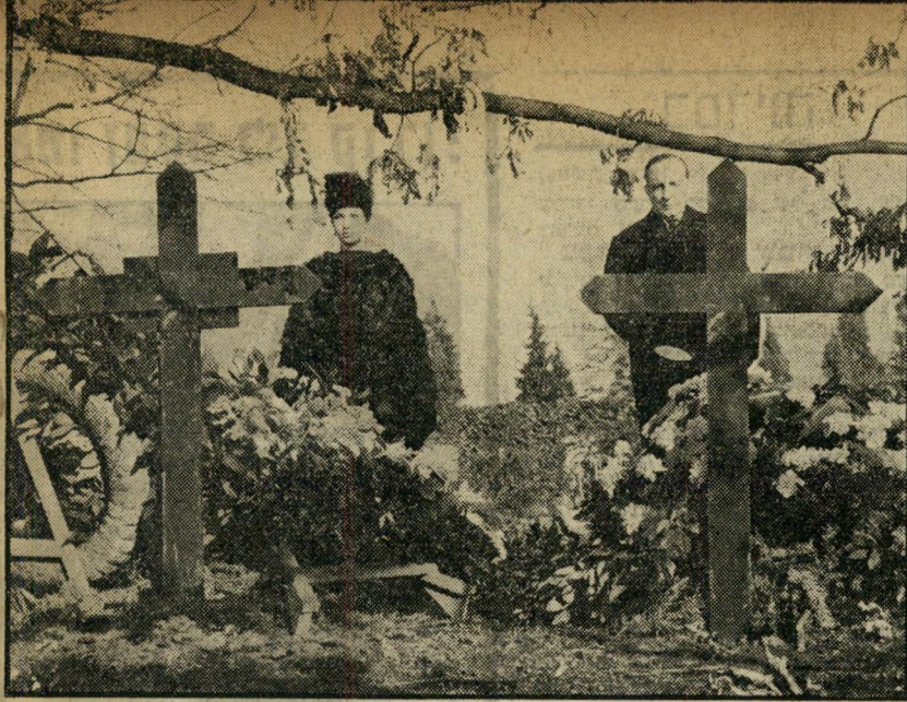
2. נשואיו של מר מיסיסיפי (שוויץ)