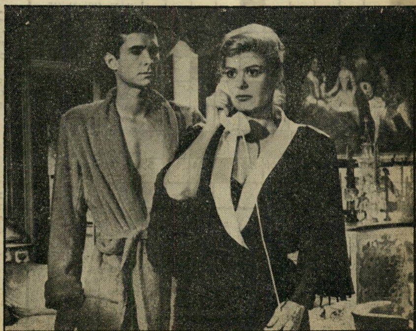
1. פדרה (יוון)