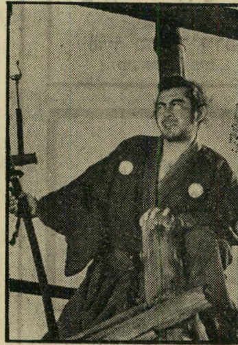
שחקן השנה טושירו מיפונה יוג'ימבו, סנ'ורו

שמה של ישראל הולך לפניו כארץ שוחרת הסרט הטוב. אף השבועון ה- אמריקאי המהימן, טיים — בסקירה על ה- קולנוע בעולם שפירסם לפני שבועיים — כלל את שמה של ישראל בין חצי תריסר המדינות בהן נקלט הקולנוע-החדש של אינגמר ברגמן ואיקרה קורוסאבה, של מיכאל-אנג'לו אנטוניוני ואן ראנה. ה- מבקרים המקומיים היללו, מודעות הפירסומת זעקו ובחגים אינטלקטואליים שימש הקול- נוע החדש נושא לויכוחים לאין סוף.