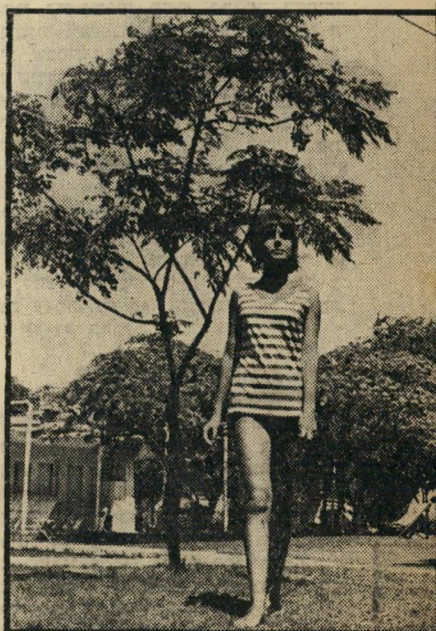
היא תשוקת צ' עירה בת שמור עממית כלכלית, מחשבתית ורגשית.

ברמת-אביב נדלק שוב האור האדום. גיזל והחזרה אקספרס הביתה, אל ספסל הלימו