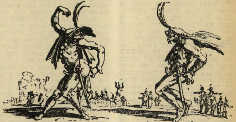
ציור מהמאה ה-17 מתאר שני שחקנים של להקה נודדת, המציגים בכיכר השוק קומדיה דל-ארטה, כשהם לבושים ב- תלבושות ובאביזרים אופייניים, בהם הופיעו שחקני הקומדיה דל-ארטה בכל מחזותיהם.

לא היו להם כל מחזות קבועים. היה להם רק סיפור-עלילה בקחים כלליים, בו