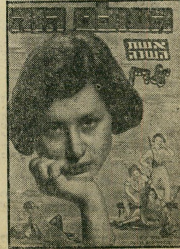
איש השנה תש"ט סופרת זיין