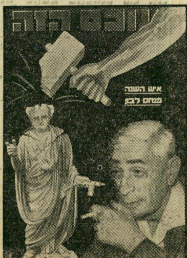
איש השנה תשכ"א מוזח לבון