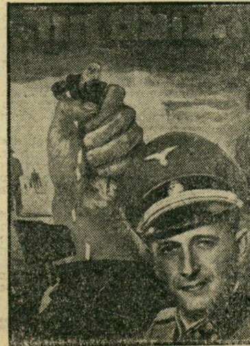
איש השנה תש"ך רכז השואה איימן