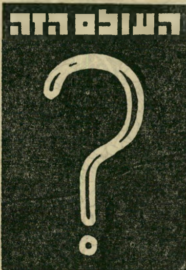
איש השנה תשכ"ג

עיתונים יהודיים בתריסר ארצות מדחחים על הבחירה, תוך הסכמה או עירעור. הקטעים מגיעים אלינו משך שבועות אחדים. הם מעניינים אותנו — אך לא יותר מדי. כי אז אנחנו כבר עוסקים בכיסוי והערכת המאורעות, שאחד מהם יספק את איש השנה הבאה.