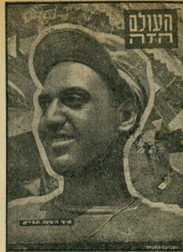
איש השנה תש"א העולה החדש