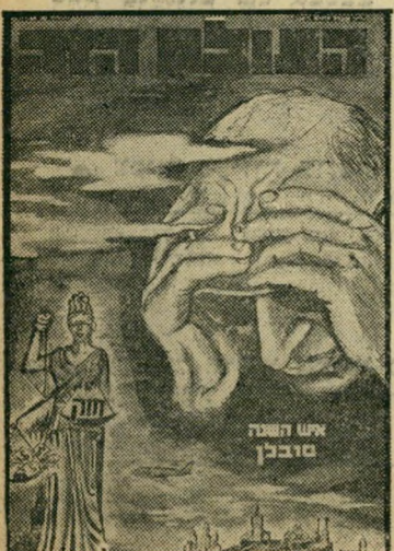
איש השנה תשכ"ב קורבן סובלן