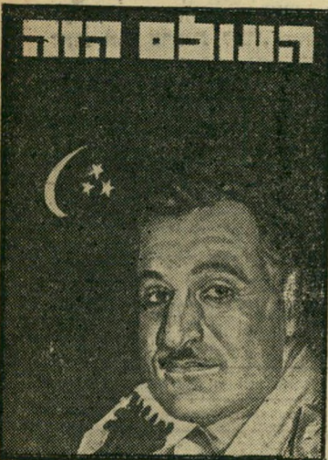
איש השנה תש"ז נשיא מצרים עבד אלנאצר

ונחתם חווה איסור הגיסויים הגרעיניים, זוהי שנה בה סולק הממונה על שירותי הבטחון ושמעון פרס הגיע לשיא הקאריירה שלו לפני שנעצר לפתע, זוהי שנה שבה נאלץ דויד בן-גוריון להרפות מן השלטון בו החזיק מזה שני דורות. איזה ממאורעות אלה חשוב יותר? איזה מהם השפיע יותר על חי המדינה ואזרחיה? ומי האיש שעמד במרכז מאורע זה, ומי אותו יותר מכל אדם אחר?