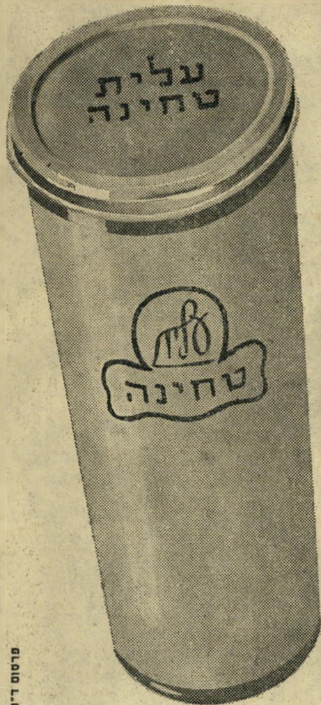
פרסום ד"ר עקבסון