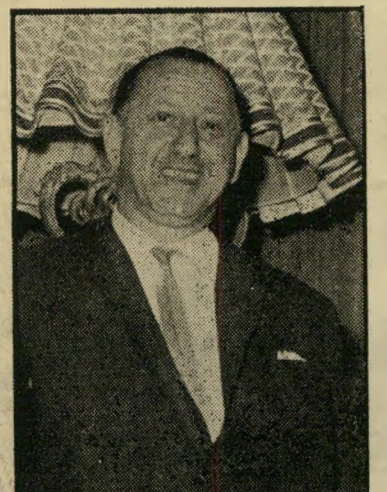
CHEZ NOUS מישל, בעל המועדון נו מופיעות הנברים הנשים, הגיע ארצה על סיפון אנית אלסלינה.

דונו, נושאות אליו חצי-תריסר נערות גר-מניות עיניים שופעות-ערגה. שמעון עצמו אינו מבזבז עליהן אף מבט אחד. הויליול הגמור הוא השיטה הטובה ביותר. המועדון הישן של שמעון נועד עתה לבני הטפשי-עשרה. זהו מבוכ של חדרים חשוכים או מוארים-למחצה, המצוייד בכמה כארים, כמה רצפות-ריקודים, פינות מוצנעות לור-גות, מקום מורם לאנשים מפורסמים. בפינה אחת מוקרנים סרטים ישנים של צ'פלין, בי-פינה אחרת משליך פנס-קסם תמונות של חתיכות ערומות על הקיר, בפינה שלישית יכול אדם לבדוק במכונה מיוחדת את מדת שיכרותו (על פי מהירות תגובותיו). האיטר-מאטים נותנים לקהל את הכל — קפה (שלושה סוגים), סיגריות, קקאו, קוקה-קולה, אמצעי-מניעה (בבית-השימוש של הנברים) וגרביים (בבית-השימוש של הנשים, לאותן שגריביון נקרעים בעת הריקוד).