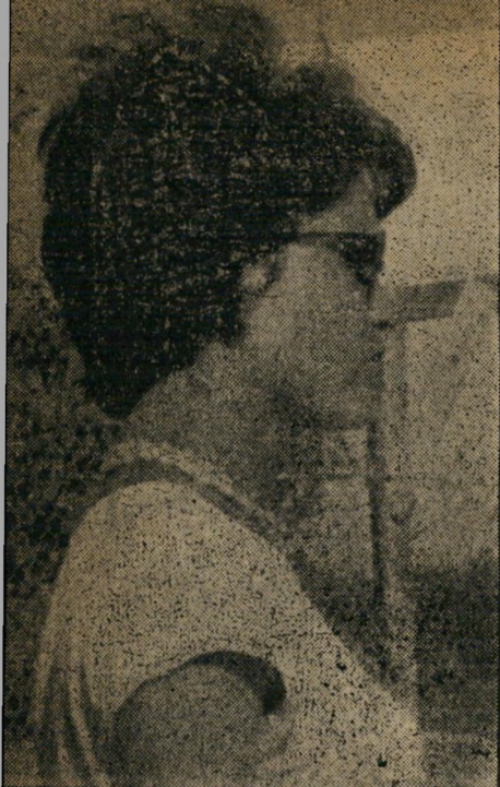
מקרה כנעני התנפלות עם סכין

הכת בבית, מדוכאת לחלוטין. מכל המעורבים בפרשה, היתה היא ה' אומללה ביותר: גם הדוקר וגם הנדקר הם הקרובים ביותר לליבה.