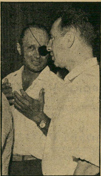
צעירים-מקצועיים פרס ודיין תוחמים ישנים יורים היטב

● "את עיקר טענותיו תולה יזהר סמ' לנסקי בהנחה אחת: אנשי שלומנו. האומ' גם אנשי שלומנו יושבים רק בצד אחד של ה"שולחן?" ולראייה: דיין וחבריו התנגדו למינוי צעירים לאינחוסים להם למשרות חשור