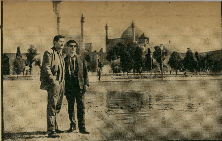
איספהאן — עיר המיסגדים והליבלוך* *מה זה כאן חיי אדם?

אך חושבי איספהאן אינם כועסים על העיר הישראלית. להיפך. הם מברכים אותם ומחייבים לעברם כאשר הם נפגשים בהם. כי החפירות והרעש נעשים למטרה אחת: להתקין באיספהאן את רשת הביוב הראשונה שלה. כאשר תושלם העבודה בימים ה-