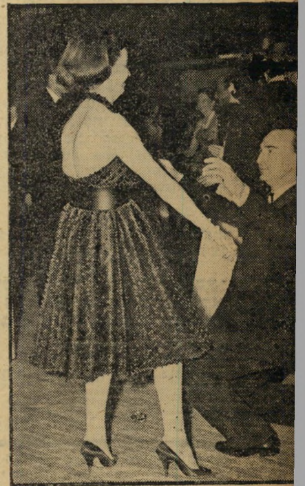
על הבורניים רוקד שר'ה מלחמה לשע'ר בר, פרופיומו, בחברת אשתו השחקנית.

שבוועה על מותו של ד"ר וורד השמה את העולם כולו, גרמה להלם, לזעזוע, לטעקה גדולה על מצפון האמה הבריטית, שיום קודם צתה בו עדיין ב"סקרנות משועשעת". הגירסה הרשמית היתה: ד"ר וורד איבד את עצמו לדעת. הוצגו המכתבים שהשאיר אחריו, וסופר על ראיון עם כתב הדיילי אקספרס. ערב מותו, בו סיפר בהתרגשות כיצד מתנכלים לו. אך עם חלוף ההדהמה הראשונה - החלו להתעורר ספקות. תחילה בצורת רמזים, ש"הפכו לבסוף לתמיהה מגובשת: האם באמת התאבד ד"ר וורד?