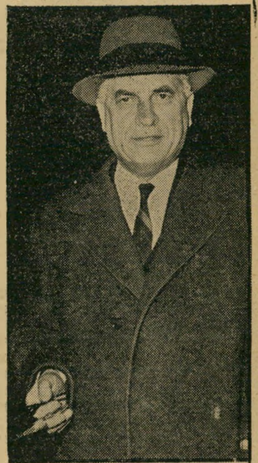
שריהפנים שפירא מחירו של הנצח

הגבר הגבוה, בריאהגוף, מחה את הויצה מעל פניו העגולות. מעולם לא נמצא אב