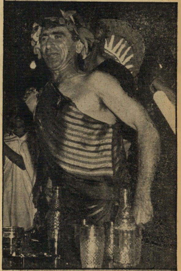
המדך ממבוש הראשון

בזאת הנני מכריז על ברית אחיות עם נסיכות תל-אביב. מהיום והלאה רשאים תושבי תל-אביב להיכנס לגבולות הממלכה באופן חופשי, אולם זאת בתנאי שתושבי ממלכת ממבוש יוכלו לבקר באופן חופשי בנסיכות הנ"ל.