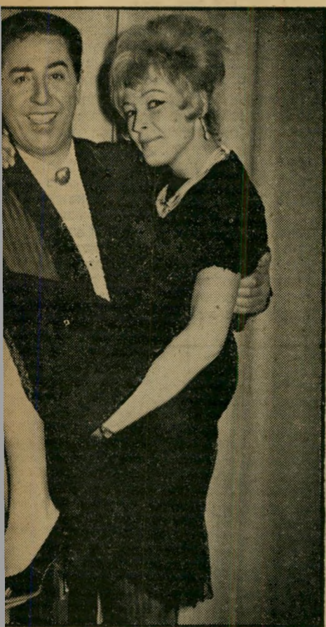
הזמר השווייצרי וימו סוריאני, נזר שישישה מנחה ו תמד את קירבתם של אמני בידור בתקוה שיבוא יו