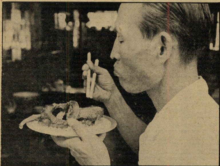
ארוחת נחשים במונרו קאנה

מבחינת העיתוי איחר הסרט את רכבת- המשאב שלו בכמה שנים. הוא נועד ללחום בחוק שראה בהומוסקסואלים פושעי-מין,