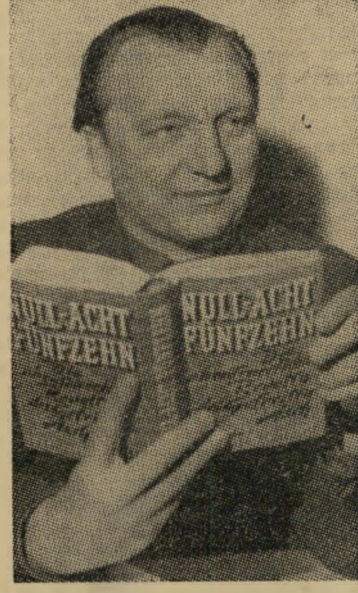
סופר קירסט רוגז כפול 08/15

איך התהפכה הקצרה על פיה בכתב בה של על המישור? איש לא ידע זאת. פחות מכולם: המחבר, עזרא ריבליס. טען השבוע הקיבוצניק הנבוך: „לא קרא“