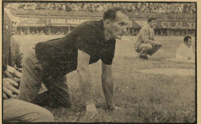
מאמן מאנדי האשראי בוזבז

לכאורה היו למשחק זה כל הנתונים להיות משחק מרתק, מלהיב ומהנה. מצד אחד עלתה על המגרש קבוצה בריטית ששמה הולך לפניו. סטוק סיטי, שעלתה השנה מליגה הבריטית השניה לליגה הראשונה, כוללת בשורותיה כחריסר שחקנים מהיר ללים, שבראשם סטנלי מתיוס, כדורגלן המאה. למרות שהגיעה לישראל למסע נופש, ברור שהיה על קבוצה זו להוכיח, בזכות מה זכתה להעפיל שוב לליגה הראשונה. מצד שני ניצבה נבחרת ישראלית, ש"הורכבה בעיקר משחקני נבחרת הנוער, אשר עמדו לפני נסיעתם לחו"ל. שום קמיע של מזל לא היה מבטיח לנבחרת זו הצלחה כמו