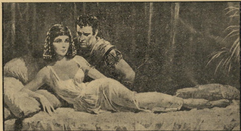
מודעת "קליאופטרה" לפני — לזוג השערווריתי

אינו פה נהרניחלידם, זקנים מתים בעינויים, ילדים מופקרים למחת, רצח