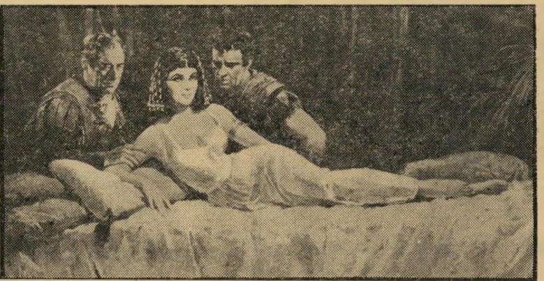
מודעת "קליאופטרה" אחרי — צלע שלישי

על החוף מוכרים את הסחורה בבקיני, או בלעדיו. שני מטר יותר גבוה — זה נמכר בתוך מכונות מרוץ, 100 קמ"ש. מעבר ל מדרכה, בארמון הפסטיבל, מוכרים באלגנ טיות, בסמוקינג, פרפר, מינק וצינציליה. במלון קארטנוז מוכר שמן קרח אחד ל שמן קרח שני את כולם ביחד.