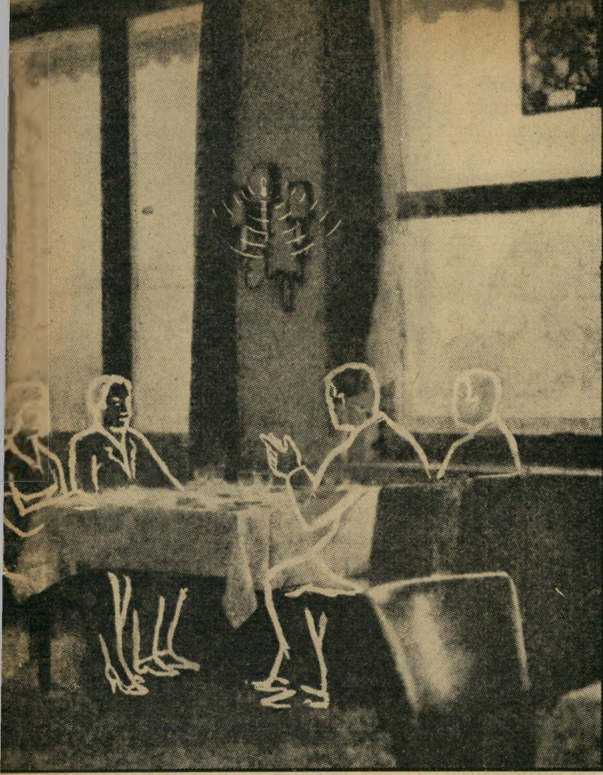
המלכודת השיחה שגרמה להתפוצצות פרשת בן-גל. מסביב לשולחן במלון שלושות המלכים בבאזל יושבים יוקליק ובו-גל ומוסלם היידי וריינר גרקה. בצידור, שהופיע בשבועון הגרמני שטרן, טומנה גם מנורת-הקיר, בה הוטמן המיקרופון.

ה שביעי פירסם השבועון המצוייר הצרפתי מאץ, באיחור, ראיון אישי עם הממונה על שרותי-הבטחון, שהתקיים עוד בראשית המסע התעמולתי. ראיון זה נערך במלון דן בתל-אביב, לפי יוזמת הממונה עצמו, שהזעיק לצורך זה את הסופר הצרפתי מפאריס.