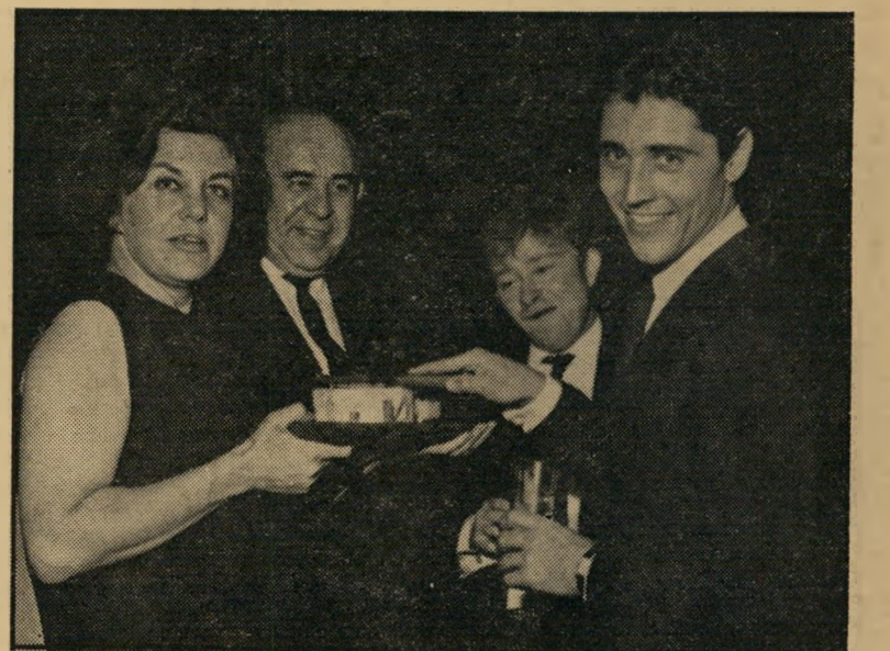
סאשה דיסטל וירידים שתחשבי שאני כאן

הרב אהרן שלמה גורן, בתשו"ב לשאלה לדעתו על המצב בירדן: "בעז"רת השם, הכל יבוא על מקומו בשלום".