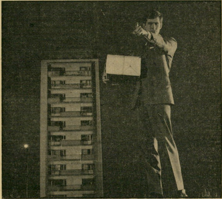
אנתוני פרקינס ב"המשפט" פקא? לאו דווקא

בין הסרטים שהמועצה לביקורת סרטים ומחזות בישראל לא אישרה את הצגתם בשנה האחרונה, נמנה גם סרט אמריקאי בשם השליח ממנצ'וריה. נושא של הסרט אינו חדש במיוחד, וסרטים על נושאים דומים כבר הוצגו בישראל. זהו סיפור על שבוי אמריקאי בקוריאה (לורנס הרביעי) העובר תהליך של שטיפת-מוח, יחד עם אמריקאים אחרים, בידי פסיכיאטר סיני. כשהוא חוזר לארצו, הוא עדיין נוהג כרצון שובי הקומוניסטים הסינים, רוצח בהשפעתם את אביו ואת אשתו ועומד לרצוח גם מועמד לנשיאות ארצות-הברית. קצין השירות-החשאי האמריקאי (פרנק סינט' רה), שהצליח להתגבר על שטיפת-מוח דר' מה, מצליח לגבור עליו ולעצרו. אם בשל האלימות שבו, ואם בשל התע' מולה האנטי-קומוניסטית החריפה שבו, לא אושר הסרט להצגה. הידיעה על כך הגיעה לפרנק סינטרה שהוא גם המפיק של הסרט. סינטרה התמרמר באוזני ידידיו הישראליים: "לא די שמחרימים אותי בארצות-ערב, וע' תה מטילה גם ישראל חרם עלי?".