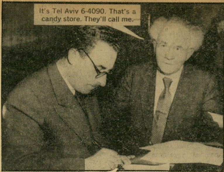
It's Tel Aviv 6-4090. That's a candy store. They'll call me.

בן-גוריון כעתון הטירוף: שתי תמונות אלה הופיעו בגליון האחרון של "מז" ("מטורף"), ירחון אמריקאי המצטיין בחומור מטורף. התצ' לום למעלה הופיע בתוך סיררה של תמונות, להן הרביקה המערבת בותרות שגעוניות דמיוניות, המתבקשות כאילו עליידי הצילום. כך גוריון נראה בתמונה זו מושחח עם משה שרת, אומר לו: "תוכל להשיג אותי במספר 64090, זה שייך לחנות המתקים. הם כבר יקראו לי". כציור למטה מודגימה המערבת מה עתיד לקרות כאשר יתבלבלו שיודרי טלבוזיה כינארציום כתוצאה מפעולת לוויינו התקשורת. האיש משמאל שואל רופא מה לעשות ביחס למחלת בנו, ואילו בן-גוריון עונה, מתוך שידור אחר: "הצטרף לקבוצה! זה מה שעושים כל הצעירים!"