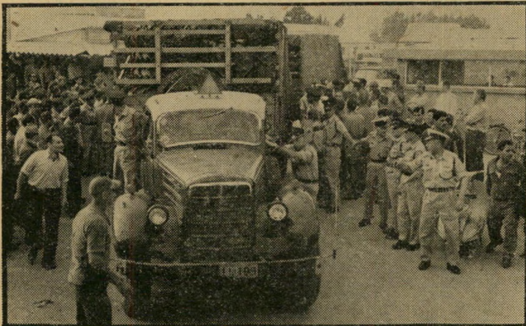
המשטרה מוציאה סחורה מבית-החרושת „שמשון“ אף לנגד צמיגים

פרטים לגבי הסעות מאורגנות לקבוצות: אגד דן תיור; מרכז ההסברה; ועדות התרבות של מועצות הפועלים.