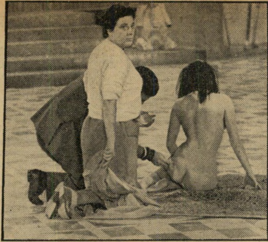
פאסקאל פטי מתאפרת ומופיעה ב"קליאופטרה"