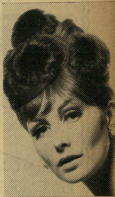
מושג עליזי איפור ב"Coverfluid בגוף החדש, "Sand Pearl". עצמות הלחיים מודגשות ב"תערובת של Silk Tone Liquid Rouge. "Coral Tone" יחד עם "Eye Shadow 'Pearl". לבסוף יאובקו הפנים קלות בפודרה זוהרת בגוף "Opaline".

כוכב בעין. הקווים מעוגלים, ולפנים הזוהר הפנימי העמום של פנינה. דבר זה