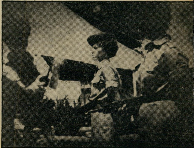
לדברי הקריינות, המלווים את הסרט, זוהי חיילת ישראלית הקוראת ספר, בשעת מנוחה מאימונים. בתוך אוהלי-המגורים שלה. לדבריה של קצינת ח"ן: "לא ייתכן שנערה ישראלית בגיל זה תלך בלי חזייה! זהו זיופה של המציאות שלנו"