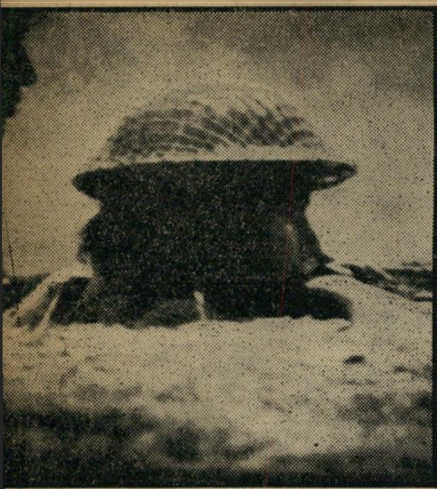
ברצינות חיילות צה"ל כפי שי צולמו רבות: בשוחה, עם קובע פלדה (למעלה) ובאימונים (למטה).