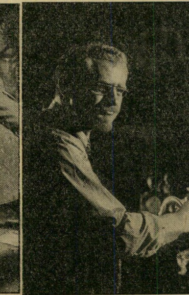
האב השען הזקן מייצג את הסיפוס היהודי השמרני, מגלם את הי הססנות והפחדנות אשר איפשרו את השואה.

הסרט כולו מתרחש למעשה במרתף הי אפולוי, שרק קרני אור מועטות חודרות אליו מבעד לחלון בודד. שפע האבירים הישנים שבמרתף, שעונים, נעליים ישנות, אלבומי-תמונות, בובת מוקיון ורהיטים, מד כירים לבלוא במרתף קטעי זכרונות מי עברו, את נעוריו ואת הדמויות שהשפיעו עליו כמו מורהו, אביו ונערתו. תוך כדי העלאת הזכרונות מתמודד הי