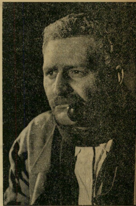
השומר זמרתו של עמנואל כשומר בניו זקן הנושא עמו את זכרונותיו, משמשת כנקודת-מוצא לעלילה.

לפני שבוע הוקרן הסרט הראשונה. שוב לא היה עוד מקום לספק: שמעון ישראלי עשה את הבלתי יאמן. הוא עשה סרט מרתק, בעל איכויות אמנותיות מעולות ותוכן רעיוני עמוק. הוא עשה סרט טוב. המימרה "סוף סוף סרט ישראלי רא-שון" הפכה מומן למליצה ריקה מתוכן, שבאה לציין רק סרט ישראלי שהיה פחות גרוע מקודמיו. סרטו של שמעון ישראלי המרתק נמצא הרחק מעבר לאימרה זו. זהו סרט שמוכיח שכדי לנבנת בארץ תעשיית סרטים ברמה בינלאומית, אין צורך באולי פנים משוכללים, גם לא בממון רב, אין צורך בכוחות מהחוג והיקוי יצירות זרות. מה שדרוש הוא רק שיהיה מה להגיד ו"כשרון לומר זאת בצורה קולנועית. שמעון ישראלי, כפי שמוכיח סרטו, מחונן בשתי תכונות נדירות אלה.