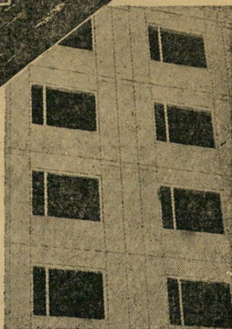
בטרום משורין לתקרות חוץ

ביח"ר: פרדס-חנה, טל. 2838, חדרה משרדים לקבלת הזמנות: תל-אביב, שד' רוטשילד 73, טל. 61379 חיפה, רחוב הרצל 1, טל. 69251 ירושלים, רחוב שלומציון המלכה 2, טלפון 27419